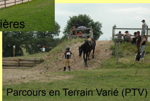
Parcours en Terrain Varié (PTV)