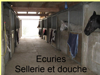
Ecuries Sellerie et douche

Tarif assujéti à la TVA : TVA 5,5% pour 68% du prix TTC et TVA 20% pour 32% du prix TTC